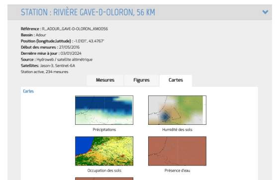
Exemple : cartes satellites pour la station Rivière Gave d'Oloron, à 56 Km de l'embouchure

(Tuto d'utilisation : https://www.theia-land.fr/wp-content/uploads/2023/12/Tutoriel-Hydrowebnext.pdf )